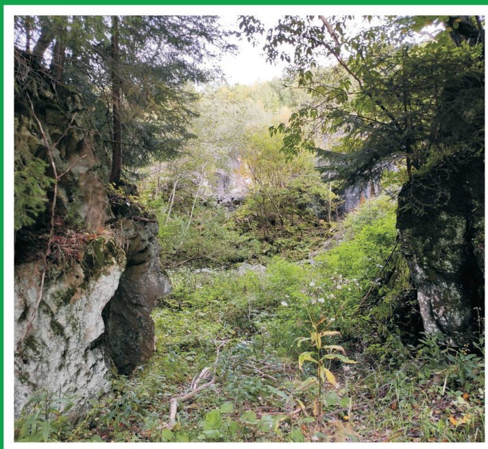
Stejně místo dnes nacházející se ve spodní části lomu. Zemina a skála nad štolou byla odtěžena a štola byla nahrazena úvozem, který je dnes z převážné části zasypán navážkou.

ZPRAVODAJ Obce Dolní Morava je dvuměsíční periodický tisk územního samosprávného celku Obce Dolní Morava. Vydává a tiskne Obec Dolní Morava, Dolní Morava 35, 561 69 Králíky. Náklad zpravodaje je 200 ks a je dodáván zdarma do domácností obce Dolní Morava. Je k dispozici v elektronické podobě na www.obecdolnimorava.cz/zpravodaj . Redakce: Ing. arch. Richard Novák, Edita Novotná, Mgr. Lucie Nováková (sazba). Do zpravodaje může kdokoliv přispět, Vaše příspěvky doručte na Obecní úřad nebo na e-mail zpravodaj@obecdolnimorava.cz . Uzávěrka je vždy 25. den lichého měsíce.