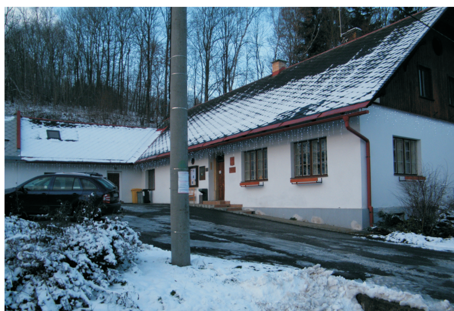
Obecní úřad dnes

ZPRAVODAJ Obce Dolní Morava je dvouměsíční periodický tisk územního samosprávného celku Obce Dolní Morava. Vydává a tiskne Obec Dolní Morava, Dolní Morava 35, 561 69 Králíky. Náklad zpravodaje je 200 ks a je dodáván zdarma do domácností obce Dolní Morava. Je k dispozici v elektronické podobě na www.obecdolnimorava.cz/zpravodaj . Redakce: Ing. arch. Richard Novák, Edita Novotná, Mgr. Lucie Nováková (sazba). Do zpravodaje může kdokoliv přispět, Vaše příspěvky doručte na Obecní úřad nebo na e-mail zpravodaj@obecdolnimorava.cz . Uzávěrka je vždy 25. den lichého měsíce.