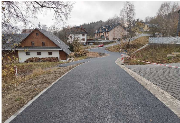
Komunikace po rekonstrukci v lokalitě Větrný vrch

Ke konci listopadu byl ukončen projekt Obce „Rekonstrukce místních komunikací – Dolní Morava“, který zahrnoval rekonstrukce komunikací ve všech třech místních částech. Na Dolní Moravě byla dokončena rekonstrukce komunikace v lokalitě Větrný vrch v místě nově dostavěného polyfunkčního objektu. Na Horní Moravě byla provedena rekonstrukce komunikace v závěru sídla k místu zvanému u křížku (obrázku). Největší rekonstrukce proběhla na Velké Moravě, a to u penzionu Na Rozcestí, kterou uvítala řada místních, aby se nemuseli vyhýbat kalužím. Dlouho odkládaná rekonstrukce této části z důvodu plánovaných investic společnosti ČEZ v dané lokalitě nakonec proběhla před těmito investicemi, avšak byla pro ně provedena příprava po konzultaci s projektanty ČEZu. Celkově všechny rekonstrukce stály přes 2 mil. Kč s krajským příspěvkem 200 tis. Kč a provedla je firma Strabag, která vyhrála na jaře výběrové řízení.