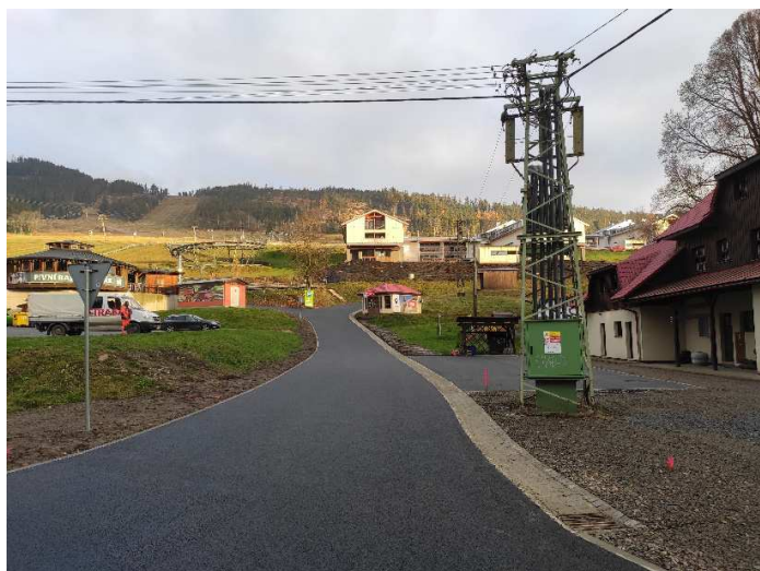
Komunikace po rekonstrukci u penzionu Na Rozcestí

Další obecní komunikací, která prochází rekonstrukcí, je komunikace od konečné kolem Bednářů po zatáčku s odbočkou do lomu. Tuto rekonstrukci provádí