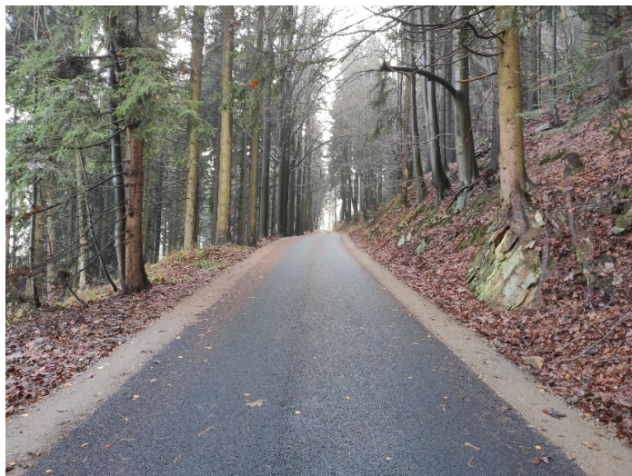
Komunikace po rekonstrukci na Horní Moravě