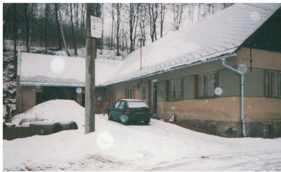
Obecní úřad před rekonstrukcí v roce 2000