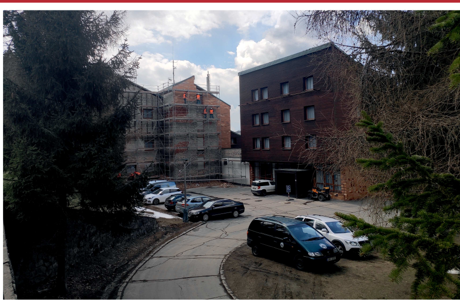
Bývalý hotel Prometheus, dnes administrativní a ubytovací budova společnosti Sněžník. V současné době prochází rekonstrukcí obvodového pláště.

ZPRAVODAJ Obce Dolní Morava je měsíční periodický tisk územního samosprávného celku Obce Dolní Morava. Vydává a tiskne Obec Dolní Morava, Dolní Morava 35, 561 69 Králíky. Náklad zpravodaje je 200 ks a je dodáván zdarma do domácností obce Dolní Morava. Je k dispozici v elektronické podobě na www.obecdolnimorava.cz/zpravodaj . Redakce: Ing. arch. Richard Novák, Edita Novotná, Mgr. Lucie Nováková (sazba). Do zpravodaje může kdokoliv přispět, Vaše příspěvky doručte na Obecní úřad nebo na e-mail zpravodaj@obecdolnimorava.cz . Uzávěrka je vždy 25. den měsíce.