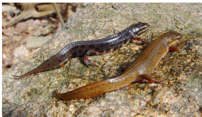
čolek obecný – sameček vlevo, samička vpravo ( Lisotriton vulgaris )

ději nitěnkami a jinými drobnými živočichy. K přeměně (metamorfóze) dochází přibližně za 3 měsíce. Ale v chladných vodách, kde nemají dostatek potravy mohou larvy přezimovat a metamorfózu prodělat až další rok. Pak se malí čolci loučí s vodou a žijí až do dospělosti na souši. Do vody se opět vracejí asi až po třech letech, aby se mohli poprvé rozmnožovat. Jeho potravu na souši tvoří drobný hmyz (brouci), larvy hmyzu, pavouci, svinky a malí červi, dešťovky a plži. V časném předjaří mohou hlavní potravu tvořit vajíčka skokana hnědého. Ve vodě loví hmyz, červy a drobné korýše.