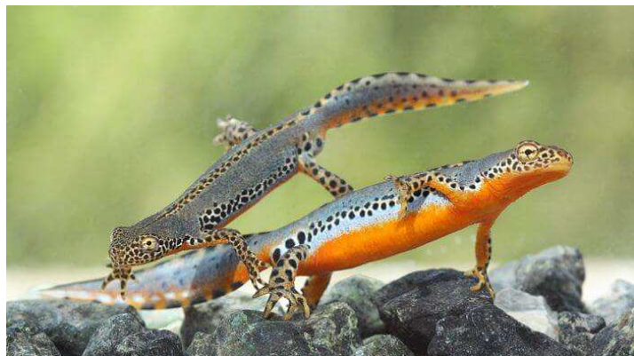
čolek horský ( Ichthyosaura alpestris )

V naší obci můžete ve spodní části narazit především na čolka obecného a v horní i na čolka horského. Lokalit, kde se vyskytují je více, mezi nejvíce známé patří mokřady na Větrném vrchu a tůně v mramorovém lomu.